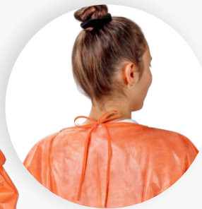
Rückseitiges Binden an Nacken und Taille