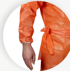
Seitliche Bindung des Taillegürtels