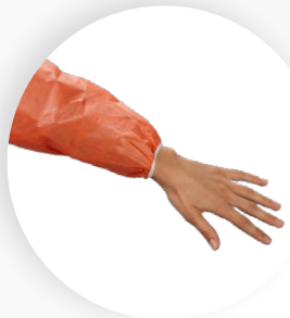
Gummibündchen am Ärmelabschluss