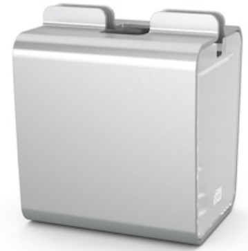
Tork XPN ServSpender, Aluminium (N4) 274002