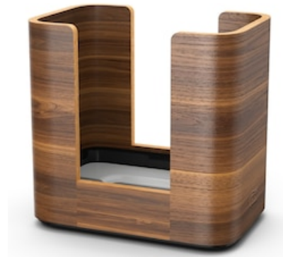
Tork XPN ServSpender, Walnuss (N4) 273002