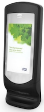
Tork XPN Steh ServSpend, Schw (N4) 272211