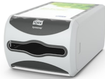
Tork XPN Theken ServSpend, Grau (N4) 272513