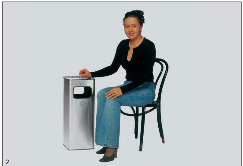
Abb.: Kombi-Ascher B 26 R Edelstahl, Art.-Nr. 3459