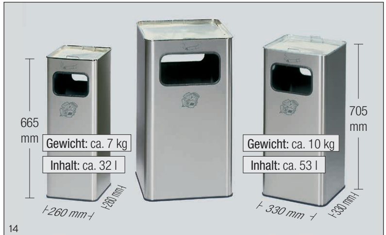
Abb.: Modellpalette Edelstahl Abfallsammler/Ascher R-Geräte

Zum Lieferumfang gehört ein verzinktes Kippensieb.