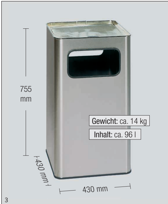
Abb.: Kombi-Ascher B 43 R Edelstahl, Art.-Nr. 3479