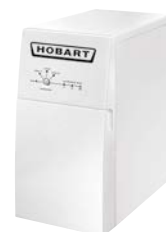
Enthärtungsanlage HYDROLINE PROTECT SE-H