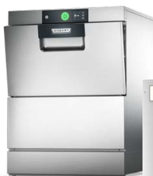
Umkehrosmose HYDROLINE PURE RO-I