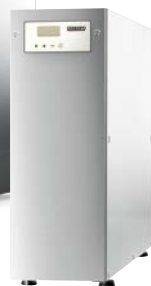
Umkehrosmose HYDROLINE PURE RO-S