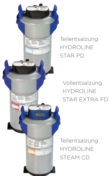
Teilentsalzung HYDROLINE STAR PD

Die Teilentsalzung entzieht dem Rohwasser den Anteil an Mineralien, der für die Karbonathärte verantwortlich ist. Dadurch ist sie für das Gläserspülen geeignet, wenn die Karbonathärte im Rohwasser einen sehr hohen Anteil an der Gesamthärte aufweist. Für das Geschirrspülen ist sie uneingeschränkt geeignet.