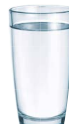
VOLLENTSALZTES WASSER/ OSMOSEWASSER