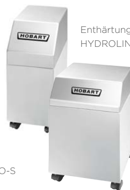
Enthärtungsanlage HYDROLINE PROTECT SD-H