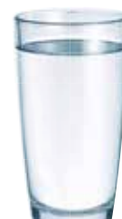
VOLLENTSALZTES WASSER/ OSMOSEWASSER