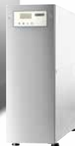
Umkehrosmose HYDROLINE PURE RO-S