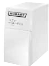
Enthärtungsanlage HYDROLINE PROTECT SE-H