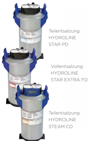
Teilentsalzung HYDROLINE STAR PD

Die Teilentsalzung entzieht dem Rohwasser den Anteil an Mineralien, der für die Karbonathärte verantwortlich ist. Dadurch ist sie für das Gläserspülen geeignet, wenn die Karbonathärte im Rohwasser einen sehr hohen Anteil an der Gesamthärte aufweist. Für das Geschirrspülen ist sie uneingeschränkt geeignet.