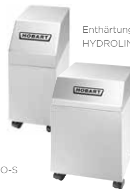
Enthärtungsanlage HYDROLINE PROTECT SD-H