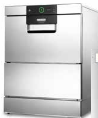
Umkehrosmose HYDROLINE PURE RO-I