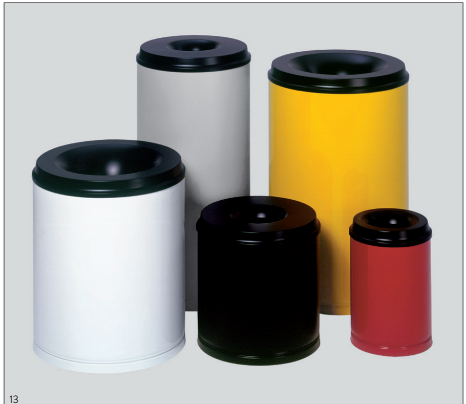
Abb.: Papierkorb 80-l, weiß besch., Art.-Nr. 3175, Papierkorb 50-l, silber besch., Ar.-Nr. 3169, Papierkorb 30-l, schwarz besch., Art.-Nr. 3152, Papierkorb 110-l, gelb besch., Art.-Nr. 3187 und Papierkorb 15-l, rot besch., Art.-Nr. 3140