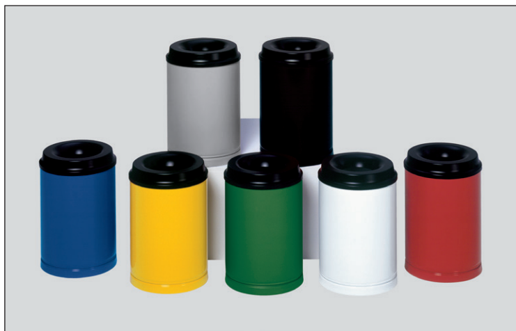
Abb.: Farbpalette Papierkörbe