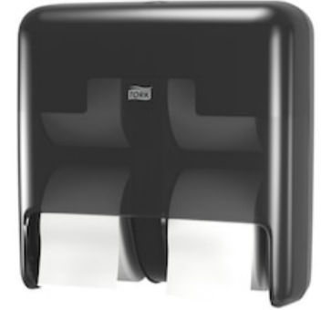
Tork OptiServe® Sp, Hülsenloses TP, 4 Ro 558052