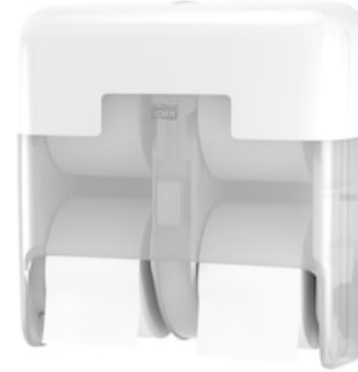
TORK OPTISERVE CORELESS 4-ROLL DIS WHI 558051