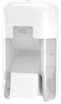
Tork OptiServe® Sp, Hülsenloses TP, 2 Ro 558041