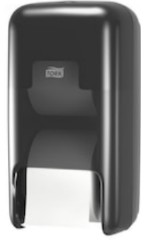
Tork OptiServe® Sp, Hülsenloses TP, 2 Ro 558042