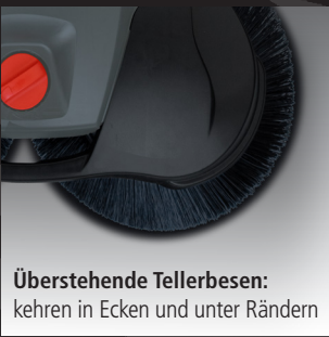
Überstehende Tellerbesen: kehren in Ecken und unter Rändern