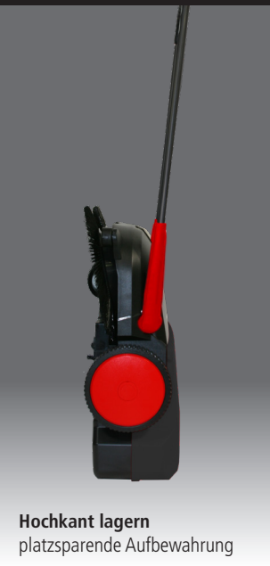
Hochkant lagern platzsparende Aufbewahrung

Statt anfälliger Riemen sorgt ein robustes Schneckengetriebe für den zuverlässigen Antrieb unserer Tellerbesen. Der Schmutz wird bereits vor der Maschine aufgenommen und direkt in den Behälter befördert – effizient und gründlich.